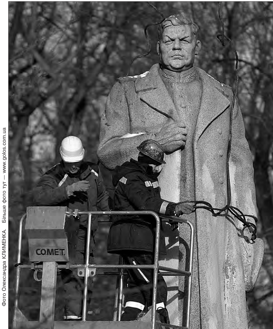
Фото Олександра КЛИМЕНКА. Більше фото тут — www.golos.com.ua