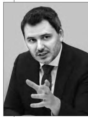
Фото Сергія КОВАЛЬЧУКА. Більше фото тут — www.golos.com.ua

позиції пропонувати перемовини України. Зараз усе залежить від того, наскільки швидко наші партнери надать нам необхідну допомогу. Це прямо впливає і на наші контрнаступні