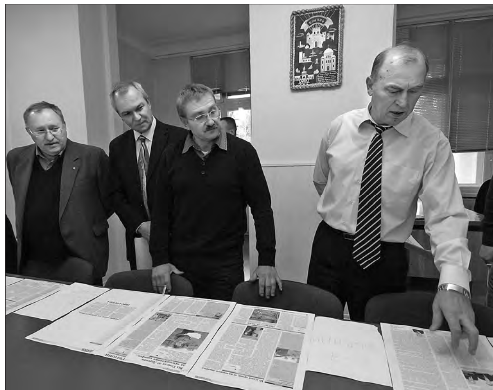
2010 рік. Вечірнє планування у «Голосі України».