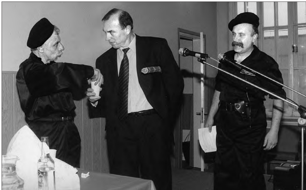
2000 рік. Новорічний «капусник».

Його не спокушали «вільні» ЗМІ, перед якими офіційний «Голос України» інколи програвав у популярності. Зате, ка-